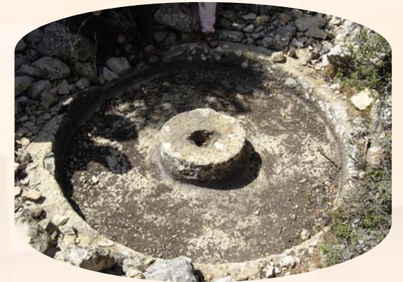
אבן היס בבית בד עתיק בהר מירון