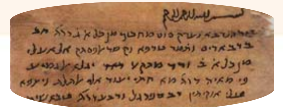
מרשם רפואי שכתב רופא יהודי מהמאה ה-11 בכתב עברי, אך בערבית. המרשם הנו מהגניזה בקהיר.